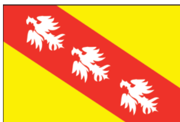
Drapeau de la Lorraine