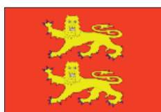
Drapeau de la Normandie

Ce sont pas moins de cinq drapeaux différents qui sont utilisés dans les régions de Basse et Haute-Normandie : drapeau armorié, drapeaux avec trois léopards, drapeau avec croix dite de « Saint-Olaf », le même drapeau avec deux ou trois léopards dans le canton. En Alsace, il existe deux versions du drapeau armorié et le drapeau « rot un wiss ».