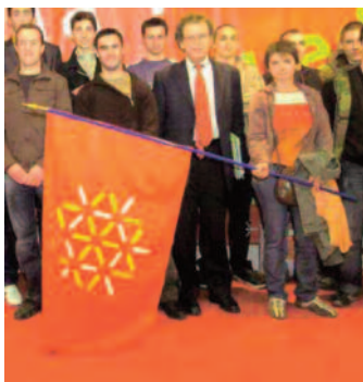
Drapeau du Languedoc-Roussillon dans la délégation régionale des jeunes disputant les qualifications nationales pour les Olympiades des métiers 2007

Outre ces drapeaux, nombreux sont les Conseil régionaux à utiliser des drapeaux blancs ou unis frappés de leur logotype, drapeaux qui n'ont de vocation qu'à promouvoir l'institution régionale qui seule peut en faire l'usage et qui donc ne peuvent pas réellement être considérés comme des drapeaux régionaux que le grand public pourrait utiliser.