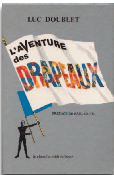
Couverture de l'ouvrage de Luc Doublet, « L'aventure des drapeaux », 1987