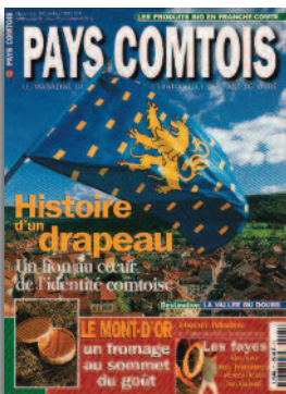
Couverture du magazine régional « Pays comtois », novembre-décembre 1998, n° 21

Il faut signaler que les conseils régionaux n'ont aucun pouvoir législatif ou réglementaire mais disposent seulement d'un pouvoir administratif. Aucun drapeau régional n'a donc été adopté officiellement par un texte explicite même si l'on sait que certaines discussions liées à un drapeau régional ont eu lieu dans certaines régions comme par exemple en Franche-Comté au milieu des années 1980. « L'officialité » d'un drapeau régional ne se mesure alors qu'à l'usage qui en est fait dans la région par le conseil régional, les mairies ou le grand public.