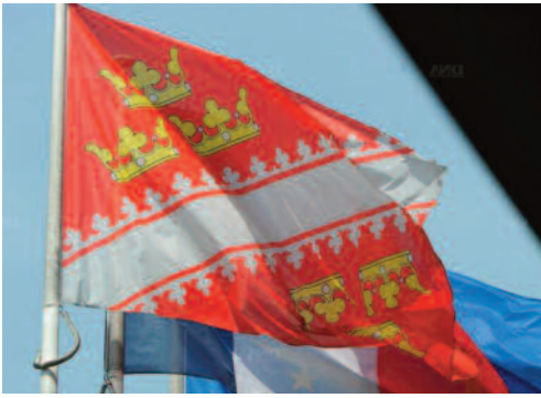
Drapeau de l'Alsace devant l'hôtel de région (2013)

On en est réduit à des conjectures. Il est possible mais cela ne reste qu'une hypothèse, qu'un conseil régional, au nom d'une ancienne province, a commandé la réalisation d'un drapeau armorié auprès d'un fabricant et que, la présence de quelques autres drapeaux « provinciaux » aidant tels ceux de la Corse, de la Lorraine, ce fabricant a proposé dans son catalogue un ensemble de drapeau armoriés pour toutes les provinces de France, ce fabricant étant probablement Doublet lui-même, qui montre ces drapeaux dans son propre ouvrage. Il resterait cependant à confirmer cela et comprendre pourquoi les éditions Larousse ont reproduit des drapeaux « provinciaux » dans leurs ouvrages dans les années 1980.