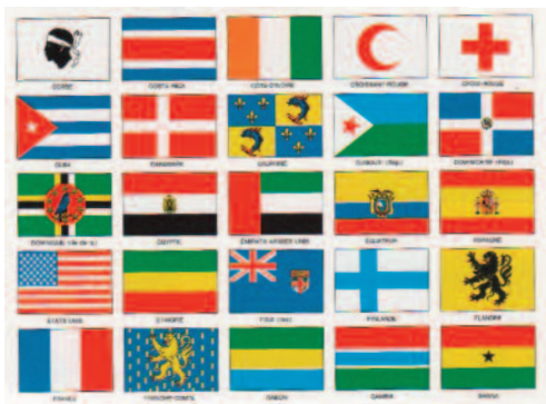
Planche de drapeaux nationaux, provinciaux, de la Croix rouge et du Croissant rouge, in : Doublet, Luc. L'aventure des drapeaux, Le cherche midi éditeur, Paris, 1987