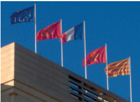
Drapeaux de l'Europe, du Languedoc-Roussillon, de la France, du Languedoc et du Roussillon sur l'hôtel de la région Languedoc-Roussillon à Montpellier (2008)