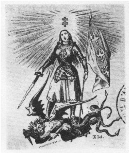
La Lorraine sous les traits de Jeanne d'Arc écrasant le monstre de l'hérésie.