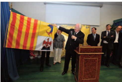
Le drapeau de Provence-Alpes-Côte d'azur présenté par le président du Conseil régional, Michel Vauzelle (2011)

On peut également citer le cas de l'ancien et de l'actuel drapeau de la région Languedoc-Roussillon ou encore celui de l'Aquitaine, qui ici néanmoins s'approche plus d'un logotype.