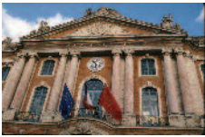
Capitole (mairie de Toulouse)