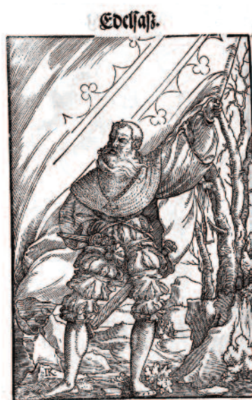
Bannière – armoiries de l'Alsace