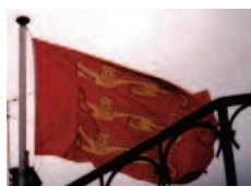
Drapeau armorié (trois léopards)