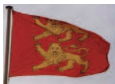
Drapeau armorié (deux léopards)

Ce sont pas moins de cinq drapeaux différents qui sont utilisés dans les régions de Basse et Haute-Normandie : drapeau armorié, drapeaux avec trois léopards, drapeau avec croix dite de « Saint-Olaf », le même drapeau avec deux ou trois léopards dans le canton. En Alsace, il existe deux versions du drapeau armorié et le drapeau « rot un wiss ».