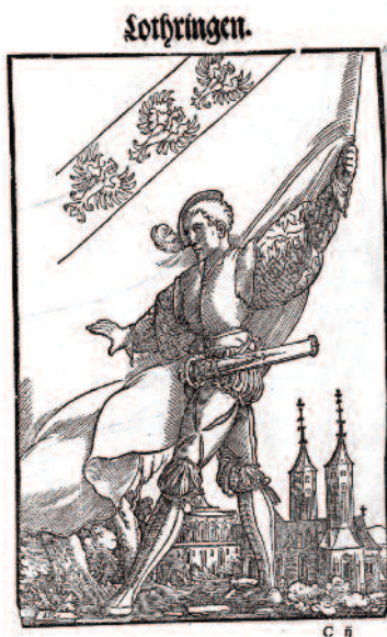
Bannière – armoiries de la Lorraine