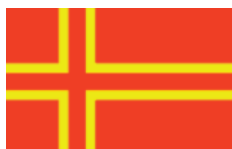
Drapeau avec croix de Saint-Olaf