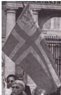
Drapeau avec croix de Saint-Olaf et trois léopards