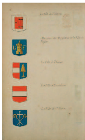
Extrait de l'armorial général. Premier volume. Haute et Basse Alsace Armoiries des villes de Turckheim, Belfort, Thann, Ensisheim et Sainte-Croix