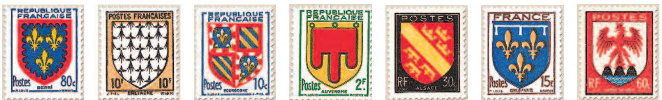
Berry Bretagne Bourgogne Auvergne Alsace Orléanais Comté de Nice