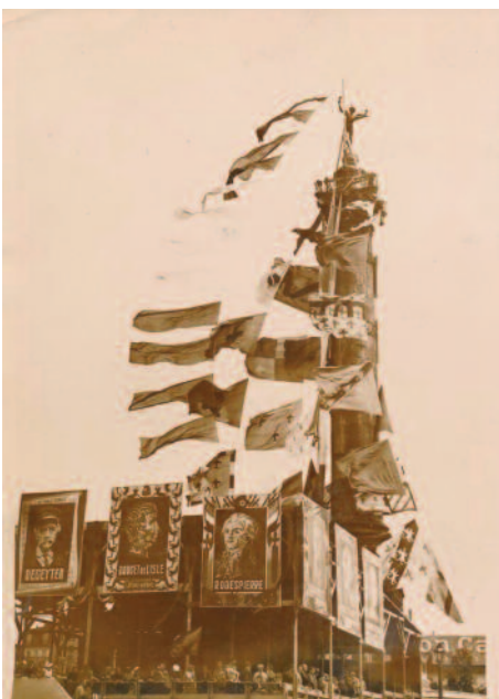
Drapeaux « provinciaux » sur la colonne de la place de la Bastille, 14 juillet 1936

Cet ensemble de drapeaux fut utilisé pour présenter de manière emblématique l'ensemble des provinces françaises, rassemblées pour former la France dans un lieu et à une date particulièrement symbolique : la Place de la Bastille et le 14 juillet. Il faut constater, toutefois, que ces drapeaux semblent ensuite avoir disparu. Aucune utilisation ultérieure n'ayant pu être constatée ou répertoriée avant la Seconde Guerre mondiale. Leur souvenir est demeuré, ne serait-ce que grâce aux nombreuses photos ou