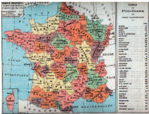
Carte tirée de l'ouvrage « Les provinces de France illustrées et leurs divisions départementales » éditions Blondel la Rougery, Paris, 1927

D'où proviennent ces drapeaux « provinciaux », notamment ceux utilisés en 1936 ? Il faut sans doute relier ces drapeaux à une certaine émergence de « régionalisme » ou de « provincialisme » apparue au cours du 19ème siècle mais il faut également les relier à une utilisation de plus en plus courante d'armoiries correspondant aux anciennes provinces de l'Ancien régime et ce, dès la fin du 19ème siècle. Outre le cas de la Lorraine abordé plus haut, on trouve ainsi de nombreux ouvrages, traitant des provinces de France ainsi que de nombreuses cartes postales décorés avec des armoiries de provinces. Ce n'est donc pas un hasard si ces armoiries bien établies et reliées aux provinces ont pu engendrer, certes d'abord de façon unique, des drapeaux armorés et « provinciaux » en 1936.