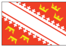
Alsace (depuis 2005)