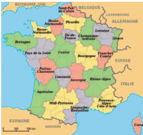
Carte des régions françaises (2013)