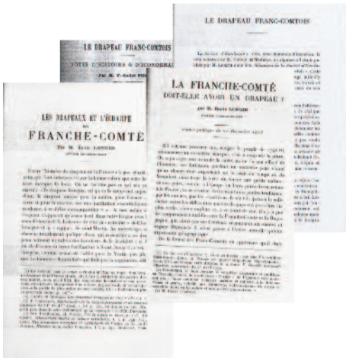
Extrait des débats sur la question d'un drapeau franc-comtois au début du 20ème siècle.

reportages cinématographiques qui ont été réalisés, même si ces derniers n'étaient pas focalisés sur ces drapeaux en particulier.