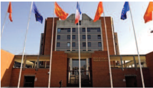
Drapeaux de Midi-Pyrénées, de France et de l'Europe devant l'hôtel de région