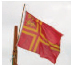
Drapeau avec croix de Saint-Olaf et deux léopards