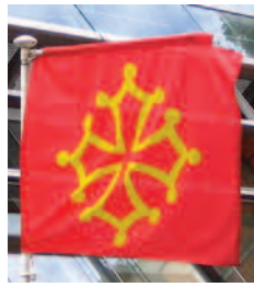
Drapeau à croix de Toulouse

Le drapeau rouge à croix de Toulouse jaune constitue un cas à part. On peut véritablement dire que ce drapeau est à usage multiple. Il est à la fois :