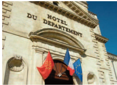
Drapeau de l'Occitanie, de France et de l'Europe sur l'hôtel du département de Lot-et-Garonne