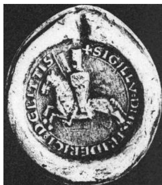
Sceau de Ferri de Bitche, duc de Lorraine ( 12ème siècle)

En second lieu, au contraire de celle portant sur le drapeau et les couleurs françaises, la littérature portant sur les drapeaux régionaux est maigre et souvent lacunaire.