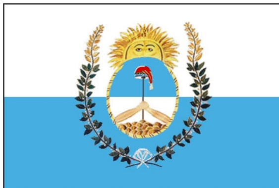
Bandera del Ejército de los Andes