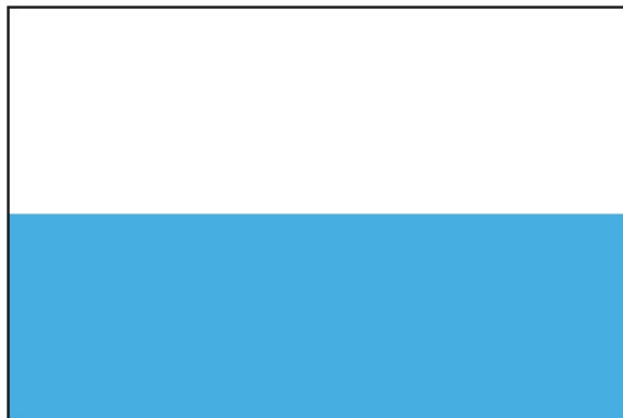
Bandera de Manuel Belgrano (1812)

Se podría decir entonces, que dichos colores del Escudo de Láziz de 1649, fueron los que adoptaron los patriotas de mayo y que naturalmente, fueron los colores de la Bandera nacional que el 27 de febrero de 1812, levantó por primera vez en Rosario Manuel Belgrano, compuesta de dos franjas, blanca la superior y azul celeste la inferior; la misma que el Primer Triunvirato desaprobó exigiendo "...se reemplace por la que se le envía..."