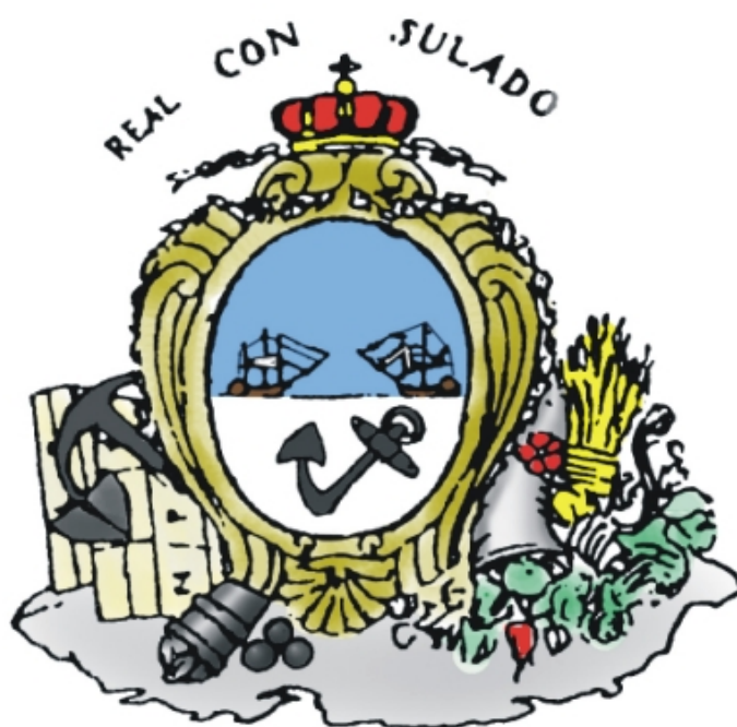
Escudo del Consulado de Buenos Aires

El 14 de enero de 1801, fue aprobado por Cédula Real el proyecto presentado por el Marqués de Sobremonte para organizar los Cuerpos de Milicias Provinciales, con el Título de "Reglamento para las Milicias disciplinadas de Infantería y Caballería del Virreinato del Río de la Plata".