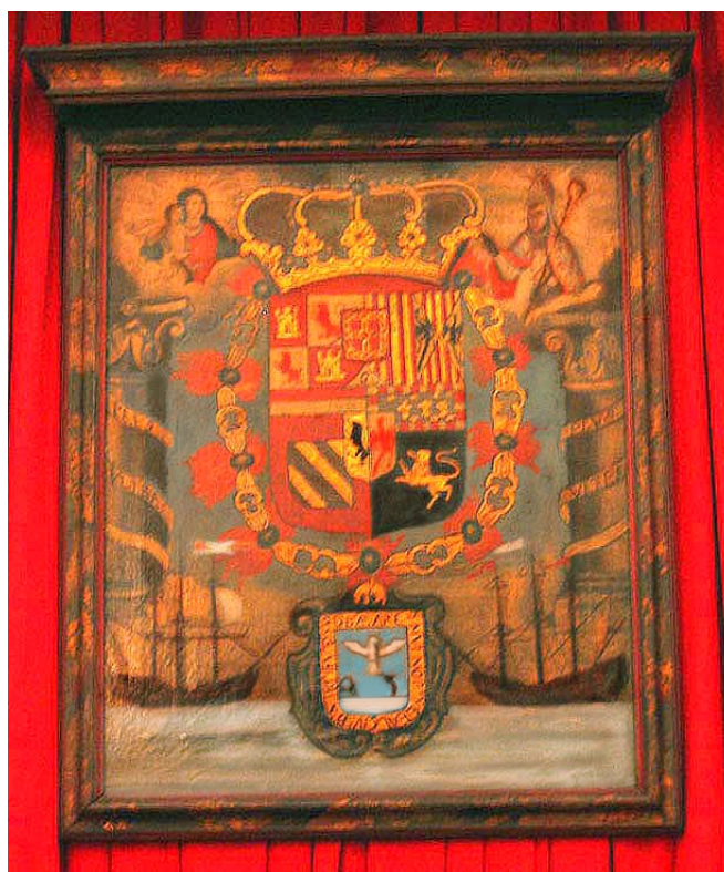
Cuadro con el escudo de Buenos Aires en el Museo Histórico del Cabildo

Dicho cuadro se encuentra en el Museo Histórico del Cabildo y en él pueden verse las Armas de Trinidad con sus esmaltes azul celeste y blanco otorgados a Buenos Aires, con una leyenda que rodea el escudo que dice en forma abreviada: LA MUY NOBLE Y MUY LEAL CIUDAD DE LA SANTISIMA TRINIDAD Y PUERTO DE BS. AS. , diferente a la que se lee en el dibujo de 1649, en la cual se expresa en abreviatura "Ciudad de la Trinidad y Puerto de Santa María de Buenos Aires". También pueden apreciarse las imágenes de Nuestra Señora de Bonaria y del Santo Patrono San Martín de Tours.