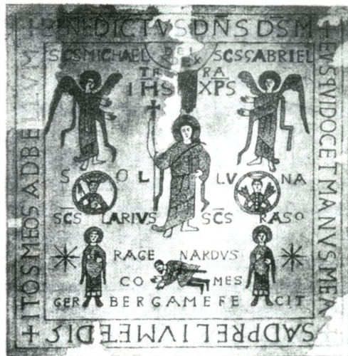
Fig. 3 - Estendard de Colònia.

Veronensis, a De Bello majoricano (3), ens diu: