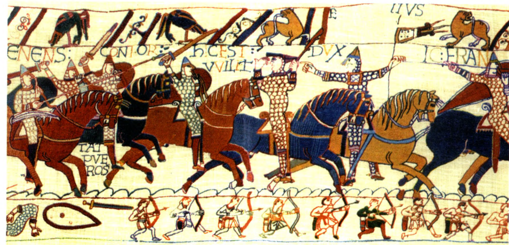
Fig. 2 - Tapís de Bayeux (detall)