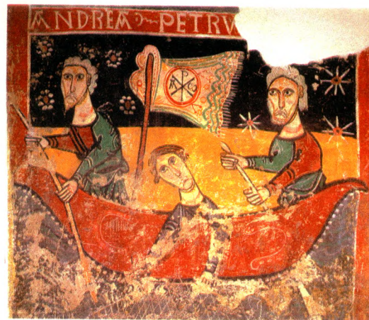
Fig. 6 - Església de Sant Pere de Sorpe