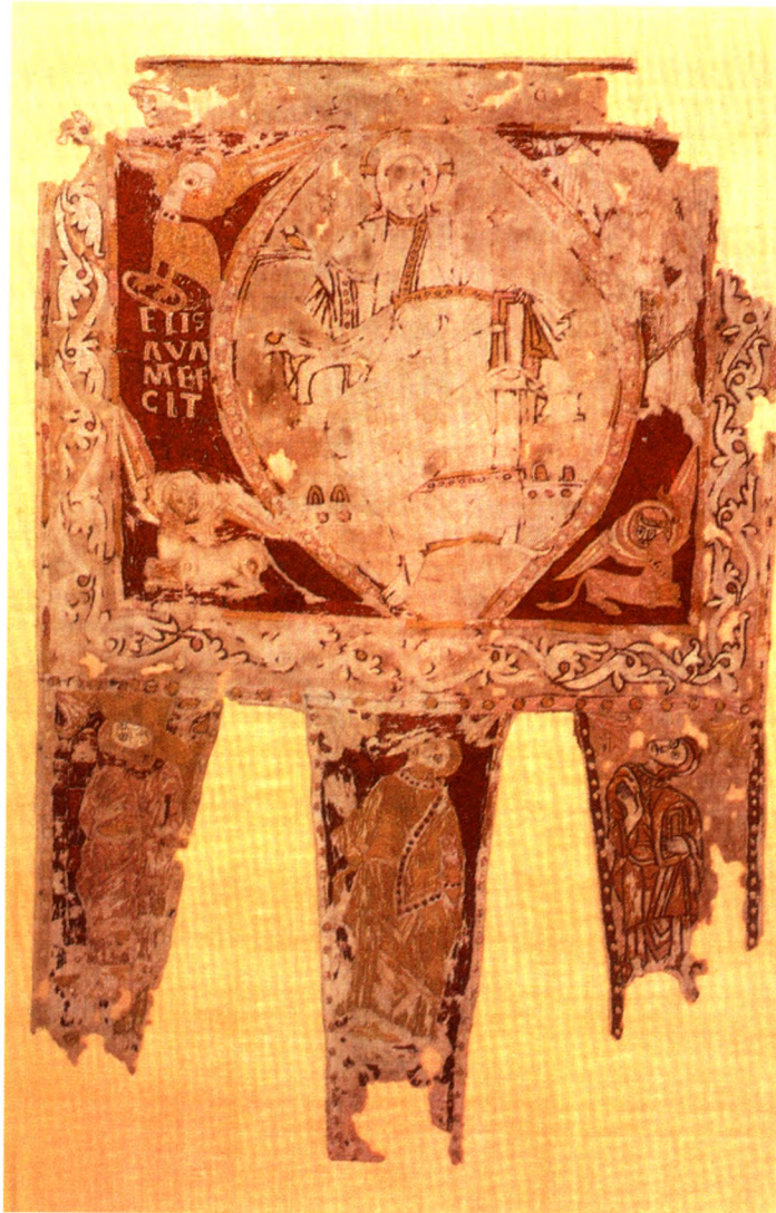
Fig. 1 - L'Estendard de Sant Ot