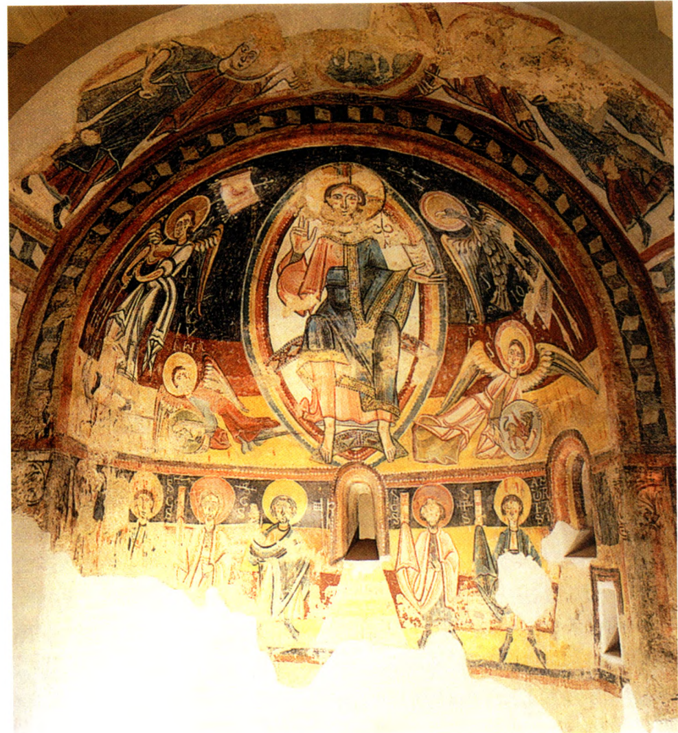
Fig. 5 - Àbsis de Sant Miquel d'Engolasters