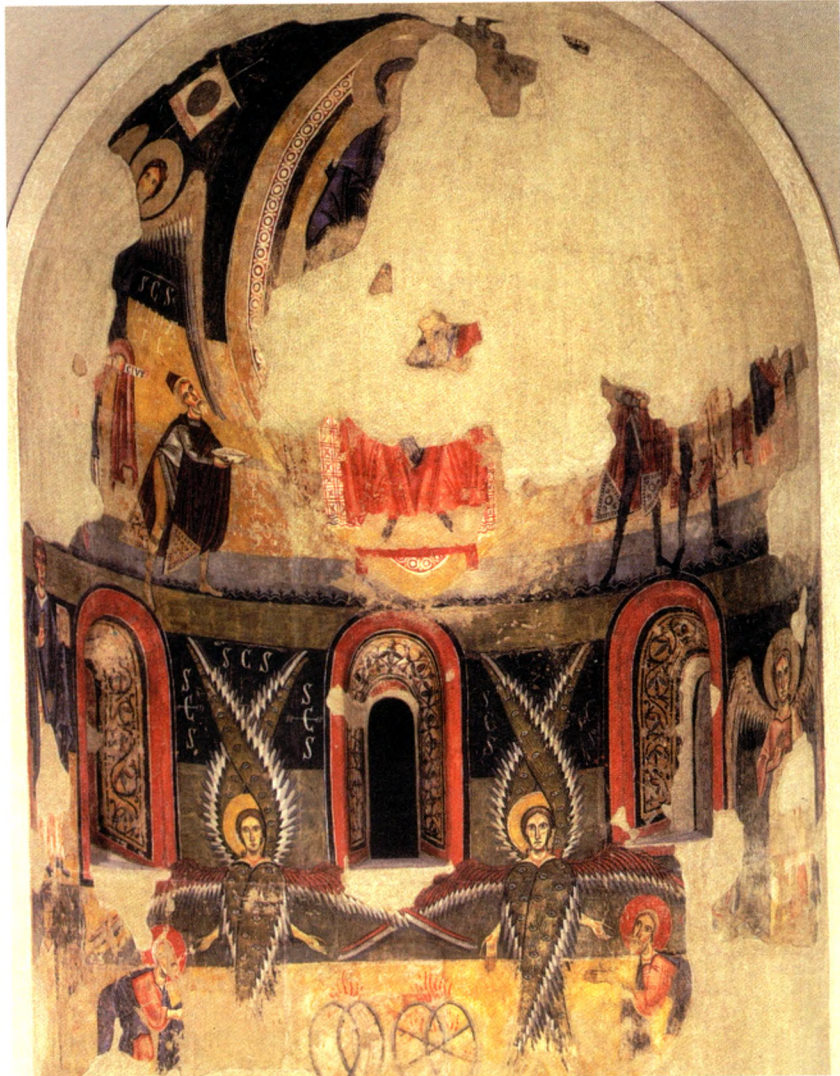
Fig. 4 - Àbsis de Santa Maria d'Aneu