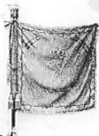
Drapeau de la brigade "Frinzes Irene"